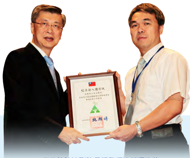
行政院陳冲副院長頒發經濟部標準獎

大同醫院今年並陸續以「身心障礙整合門診—以復健醫療為例」入圍「SNQ國家品質標章獎」、「大同醫院ROT案」入圍行政院公共工程委員會「第9屆民間參與公共建設金擘獎」（兩獎項至截稿日前